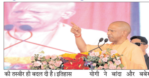
की तस्वीर ही बदल दी है। इतिहास योगी ने बांदा और बबरेठ

बांदा, 09 जुलाई। मुख्यमंत्री योगी आदित्यनाथ ने बृहस्पतिवार को समाजवादी पार्टी (सपा) और कांग्रेस पर आरोप लगाया कि उनकी सरकारों ने बुंदेलखंड को डकैत और स्थानीय युवाओं को तमंचे पकड़ा दिये थे, अगर भारतीय जनता पार्टी (भाजपा) सरकार ने मूलभूत ढांचे, रोजगार और डिफेंस इंडस्ट्रियल कॉरिडोर के जरिये इस पिछड़े इलाके