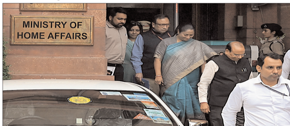
की योजना बनाने में शामिल थे।

नई दिल्ली, 04 जुलाई। जम्मू-कश्मीर में सीमा-पार से संचालित हो रहे आतंकी नेटवर्क की कमर तोड़ने के लिए केंद्र सरकार ने एक बहुत बड़ा कदम उठाया है। केंद्रीय गृह मंत्रालय ने शनिवार (4 जुलाई, 2026) को एक आधिकारिक गजट नोटिफिकेशन जारी करते हुए गैरकानूनी गतिविधियों (रोकथाम) अधिनियम के तहत 23 पाकिस्तान स्थित अपराधियों को 'आतंकवादी' घोषित कर दिया है। ये सभी आतंकी पाकिस्तान में बैठकर लश्कर-ए-तैयबा, जैश-ए-मोहम्मद और द रेजिस्टेंस फ्रंट जैसे खूंखार संगठनों के लिए काम कर रहे हैं। गृह मंत्रालय ने कहा कि ये लोग कथित तौर पर जम्मू-कश्मीर में आतंकी भर्ती, घुसपैठ, ट्रेनिंग, ड्रोन के जरिए हथियार सप्लाई करने और हमलों