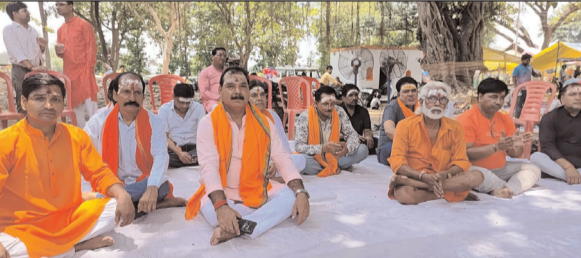
जौनपुर (उत्तरशक्ति)। बोल बम कांवरिया संघ जौनपुर की ओर से श्रावण मास में आयोजित होने वाली भव्य कांवर यात्रा एवं शोभायात्रा की तैयारियों को लेकर एक आवश्यक बैठक शंभूगंज स्थित शिव मंदिर परिसर में संपन्न हुई।