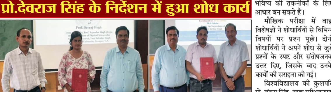
जौनपुर (उत्तरशक्ति)। वीर बहादुर सिंह पूर्वांचल विश्वविद्यालय में हुए दो महत्वपूर्ण शोध कार्य भविष्य में ऊर्जा संरक्षण, औद्योगिक विकास और आधुनिक तकनीक के क्षेत्र में उपयोगी साबित हो सकते हैं।

जौनपुर (उत्तरशक्ति)। वीर बहादुर सिंह पूर्वांचल विश्वविद्यालय में हुए दो महत्वपूर्ण शोध कार्य भविष्य में ऊर्जा संरक्षण, औद्योगिक विकास और आधुनिक तकनीक के क्षेत्र में उपयोगी साबित हो सकते हैं। भौतिक विज्ञान विभाग के अंतर्गत किए गए इन अध्ययनों में ऐसे पदार्थों और नैनो द्रवों के गुणों का विश्लेषण किया गया है, जिनका उपयोग बेहतर ऊर्जा प्रबंधन, उन्नत इलेक्ट्रॉनिक उपकरणों, ताप नियंत्रण प्रणालियों और औद्योगिक उत्पादन में किया जा सकता है।