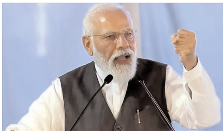
भागीदारी वाले प्रमुख प्लेटफॉर्म 'मायगोव इंडिया' के अनुसार, पीएम मोदी के नेतृत्व में पिछले 12 सालों में मध्यम वर्ग के रहन-सहन के स्तर में बड़ा उछाल आया है। देश में इंटरनेट

इंफ्रास्ट्रक्चर और डिजिटल क्रांति में अभूतपूर्व प्रगति केंद्र सरकार के नागरिकों की