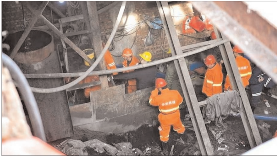
सरकारी समाचार एजेंसी 'शिन्हुआ' के अनुसार, चांगझी शहर की लिउशेन्गु कोयला खदान में यह हादसा शुरुवार शाम को हुआ। जिस वक्त यह हादसा हुआ उस समय करीब 247 श्रमिक खदान में काम कर रहे थे। इससे पहले 'शिन्हुआ' ने शनिवार सुबह खबर में बताया था कि हादसे में आठ लोगों की मौत हुई

चीन, 23 मई। चीन के उत्तरी प्रांत शानशी की एक कोयला खदान में विस्फोट के कारण कम से कम 90 मजदूरों की मौत हो गई। बीजिंग के आधिकारिक मीडिया ने शनिवार को बताया कि अब तक 201 खनिकों को बचाया गया है। गैस विस्फोट शुरुवार शाम लिउशेन्गु कोयला खदान में हुआ। विस्फोट के बाद से बचाव अभियान जारी है। सरकारी समाचार पत्र 'चाइना डेली' की खबर के अनुसार, उत्तरी चीन के शानशी प्रांत के क्विनयुआन काउंटी में कोयला खदान में विस्फोट होने से मारे गए लोगों की संख्या बढ़कर 90 हो गई है। चीन के राष्ट्रपति शी जिनपिंग ने व्यापक पैमाने पर बचाव अभियान चलाए जाने और घायलों का उपचार सुनिश्चित किए जाने के निर्देश दिए हैं।