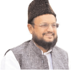
समाज की हिस्सेदारी को कमजोर करने की दिशा में काम कर रही है। उन्होंने कहा कि आज देश में यह सवाल उठ रहा है कि भाजपा शासित राज्यों में पिछड़े वर्ग को