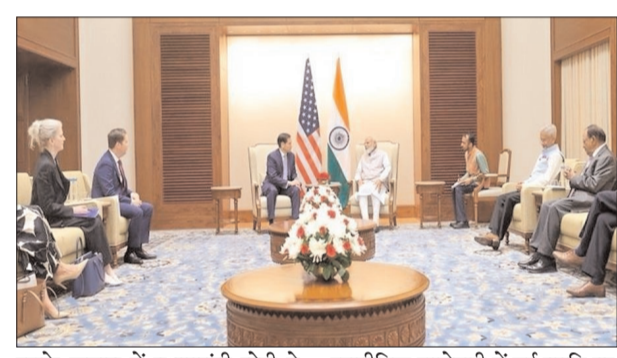
इसके जवाब में प्रधानमंत्री मोदी ने कहा कि भारत हमेशा शांति, संवाद और कूटनीति के जरिए विवादों के समाधान का समर्थन करता है। प्रधानमंत्री मोदी ने सोशल मीडिया प्लेटफॉर्म पर लिखा कि भारत और अमेरिका वैश्विक हितों के लिए मिलकर काम करते रहेंगे। उन्होंने भारत-अमेरिका व्यापक वैश्विक

नई दिल्ली, 23 मई। प्रधानमंत्री नरेंद्र मोदी ने शनिवार को अमेरिकी विदेश मंत्री मार्को रुबियो के साथ नई दिल्ली में व्यापक बातचीत की। इस दौरान रक्षा, व्यापार, ऊर्जा सुरक्षा, निवेश, रणनीतिक तकनीक और वैश्विक सुरक्षा जैसे कई अहम मुद्दों पर चर्चा हुई। प्रधानमंत्री कार्यालय (PMO) के मुताबिक, मार्को रुबियो ने भारत-अमेरिका सहयोग में लगातार हो रही प्रगति की जानकारी दी। बातचीत में रक्षा सहयोग, ऊर्जा सुरक्षा, कनेक्टिविटी, शिक्षा, व्यापार और लोगों के बीच संपर्क बढ़ाने जैसे विषय शामिल रहे। बैठक में पश्चिम एशिया की मौजूदा स्थिति पर भी विस्तार से चर्चा हुई। रुबियो ने अमेरिका का दृष्टिकोण भारत के सामने रखा।