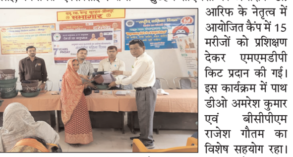
फाइलेरिया मरीजों के लिए लगा विशेष कैंप, 23 मरीजों को मिला प्रशिक्षण और एमएमडीपी किट