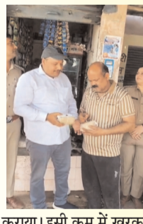
जौनपुर में अवैध 'दोहरा' कारोबार पर प्रशासन का बड़ा शिकंजा, कई दुकानों पर छापेमारी