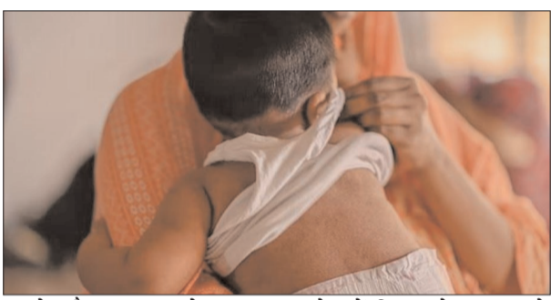
मामले और 8,494 प्रयोगशाला-पुष्टि मामले दर्ज किए गए हैं। स्वास्थ्य विशेषज्ञों ने चेतावनी दी है कि इस बीमारी का सबसे ज्यादा खतरा 5 साल से कम उम्र के बच्चों को है। विशेष रूप से वे बच्चे जिन्होंने अभी तक टीका नहीं लगवाया है या जिनका टीकाकरण अधूरा है, वे मौत के मुंह में समा रहे हैं। विश्व स्वास्थ्य संगठन ने पिछले महीने ही आगाह किया था कि नियमित टीकाकरण

ढाका, 23 मई। पड़ोसी देश बांग्लादेश इस समय खसरे के भयानक प्रकोप की चपेट में है। स्वास्थ्य अधिकारियों द्वारा शनिवार को जारी आंकड़ों के अनुसार, इस जानलेवा बीमारी ने देश में अब तक 500 से ज्यादा बच्चों की जान ले ली है। यह पिछले कई दशकों में बांग्लादेश में खसरे का सबसे भीषण प्रकोप माना जा रहा है। रिपोर्ट के मुताबिक, खसरे के मामले पिछले कुछ महीनों में इतनी तेजी से फैले हैं कि वहां के अस्पतालों में अब जगह कम पड़ने लगी है। खासकर ग्रामीण इलाकों और घनी आबादी वाली कम आय वाली बस्तियों में स्वास्थ्य सेवाएं इस बोज़ के तले पूरी तरह चरमरा गई हैं। स्वास्थ्य निदेशालय के आंकड़ों के अनुसार, 15 मार्च से 23 मई के बीच देशभर में 62,507 संदिग्ध