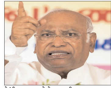
केंद्रीय कर लगाने के बाद भी भाजपा की भूख शांत नहीं हुई है। जब अंतरराष्ट्रीय कीमतें कम थीं, तो उन्होंने इसका लाभ जनता तक नहीं पहुंचाया - बल्कि उन्हें बेरहमी से लूटा। जब संकट आया, तो वे सीधे चुनाव में कूद पड़े, और चुनाव के बाद त्याग का उपदेश देने लगे। प्रशासन के इस दावे का खंडन करते हुए कि भारत में ईंधन की कीमतें विदेशी देशों की तुलना में कम हैं, खरगे ने इस बात का तुलनात्मक विश्लेषण प्रस्तुत किया कि किस प्रकार अंतरराष्ट्रीय सरकारों ने पश्चिम

नई दिल्ली, 23 मई। कांग्रेस अध्यक्ष मल्लिकार्जुन खरगे ने शनिवार को ईंधन की कीमतों में एक बार फिर बढ़ोतरी करने पर भाजपा के नेतृत्व वाली केंद्र सरकार की कड़ी आलोचना करते हुए आरोप लगाया कि सत्ताधारी पार्टी आम आदमी की कमाई को किशतों में लूट रही है। कीमतों में हुई इस नवीनतम बढ़ोतरी पर प्रतिक्रिया देते हुए खरगे ने कहा कि अतीत में जब अंतरराष्ट्रीय कच्चे तेल की कीमतें गिरीं, तो केंद्र सरकार ने नागरिकों को इसका पूरा लाभ नहीं दिया। उन्होंने कांग्रेस के इस आरोप को भी दोहराया कि प्रधानमंत्री नरेंद्र मोदी समझौते के तहत काम कर रहे हैं। खरगे ने पर एक पोस्ट में लिखा कि पेट्रोल की कीमत अब 100 रुपये के पार पहुंच गई है। इस बार तो जनता की कमाई को किशतों में लूटा जा रहा है! पेट्रोल-डीजल पर प्रतिदिन 1000 करोड़ रुपये का