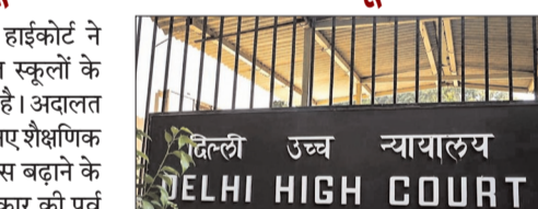
कि दिल्ली स्कूल शिक्षा अधिनियम के तहत स्कूलों की जिम्मेदारी केवल इतनी है कि वे सत्र शुरू होने से पहले अपनी प्रस्तावित फीस का विवरण निदेशालय को सौंप दें, अदालत ने निदेशालय की