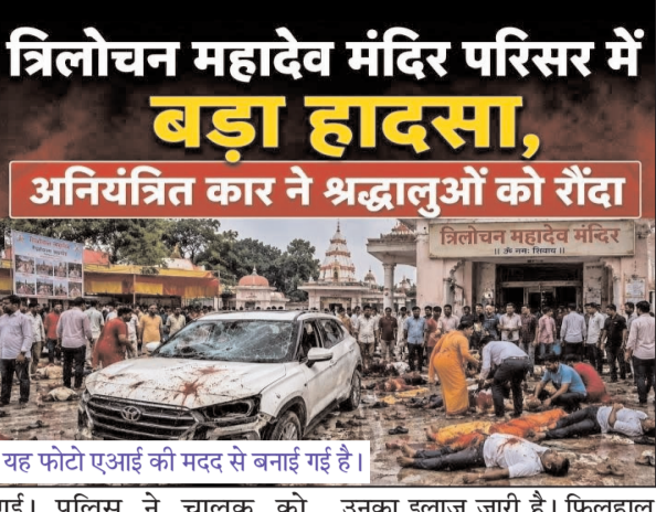
यह फोटो एआई की मदद से बनाई गई है।