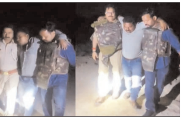
अलग अलग जगह पब्लिक का सामना करते हुए अपने को उनके हत्यारोपियों को मुठभेड़ में गोली मारने का काम किया।

प्रयास रंग लाई। पिछले दिनों दोनो जांबाज दो चंगुल से बचाये और आज इन्ही दोनो ने 50-50 हजारी दो