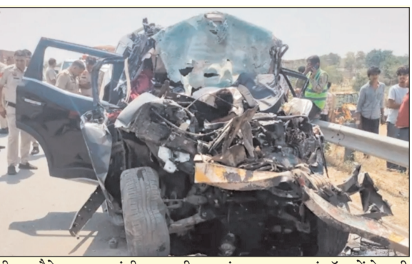
टीम मौके पर पहुंची। काफी पहुंचाया गया, जहां डॉक्टरों ने सभी को मृत घोषित कर दिया।

चालक शामिल हैं। सभी पुलिसकर्मी अपहरण के एक मामले में दबिश देने हरियाणा गए थे और कार्रवाई के बाद वापस लौट रहे थे, तभी रास्ते में यह हादसा हो गया। प्रत्यक्षदर्शियों के मुताबिक, स्कॉर्पियो वाहन चालक ने एक्सप्रेस-वे पर ओवरटेक करने का प्रयास किया, इसी दौरान वाहन अनियंत्रित हो गया और आगे चल रही गाड़ी से जोरदार टक्कर हो गई। टक्कर इतनी भीषण थी कि वाहन के परखच्चे उड़ गए और उसमें सवार सभी लोग बुरी