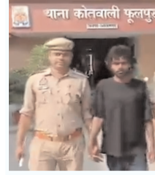
याना कोतवाली फूलपुर

मो.इमरान फारूख आजमगढ़ (उत्तरशक्ति)। जनपद के थाना फूलपुर क्षेत्र में हुई चाकूबाजी की घटना में पुलिस ने त्वरित कार्रवाई करते हुए मुख्य आरोपी को गिरफ्तार कर लिया है। घटना के बाद क्षेत्र में फैली दहशत के बीच पुलिस की सक्रियता से मामले का शीघ्र खुलासा हो गया। प्राप्त जानकारी के अनुसार, थाना फूलपुर पुलिस को जैसे ही चाकू से हमला किए जाने की सूचना मिली, तत्काल टीम गठित कर आरोपी की तलाश शुरू कर दी गई। पुलिस ने प्रभावी घेराबंदी करते हुए आरोपी को गिरफ्तार कर लिया। तलाशी के दौरान उसके कब्जे से घटना में प्रयुक्त चाकू भी बरामद किया गया है। पुलिस अधिकारियों ने बताया कि आरोपी के खिलाफ संबंधित धाराओं में मुकदमा दर्ज कर लिया गया है और उसे न्यायालय भेजने की कार्रवाई की जा रही है। साथ ही, घटना के पीछे के कारणों की भी जांच की जा रही है। पुलिस ने आमजन से शांति बनाए रखने की अपील करते हुए आश्वासन दिया है कि कानून व्यवस्था से खिलवाड़ करने वालों के खिलाफ सख्त कार्रवाई जारी रहेगी।