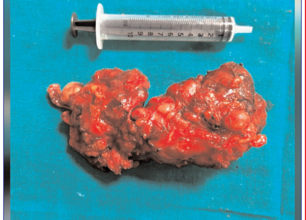
उन्नत चिकित्सा क्षमताओं, उत्कृष्ट टीम वर्क एवं मरीजों के प्रति समर्पण का प्रतीक है। उन्होंने यह भी आश्चर्य किया कि भविष्य में भी संस्थान में इसी प्रकार की आधुनिक एवं उच्चस्तरीय चिकित्सा सेवाएं निरंतर विकसित की जाती रहेंगी, जिससे क्षेत्रीय जनता को अधिकतम लाभ मिल सके।