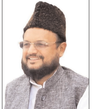
पत्र में यह भी उल्लेख किया गया कि वर्ष 2019 तक उनके खिलाफ कोई गंभीर आपराधिक मामला नहीं था, लेकिन लोकसभा चुनाव जीतने के बाद अचानक बड़ी संख्या में मुकदमे दर्ज किए गए, जिससे न्याय व्यवस्था की