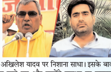
अतुल प्रधान ने राजभर की घेराबंदी की।

जौनपुर (उत्तरशक्ति)। लखनऊ उत्तर प्रदेश विधानसभा उत्तर प्रदेश विधानसभा के विशेष सत्र के दौरान उस समय माहौल गरमा गया जब मंत्री ओम प्रकाश राजभर पर समाजवादी पार्टी के विधायक अतुल प्रधान ने तीखा हमला बोला। महिला आरक्षण से जुड़े नारी शक्ति वंदन अधिनियम पर चर्चा के दौरान राजभर ने सपा