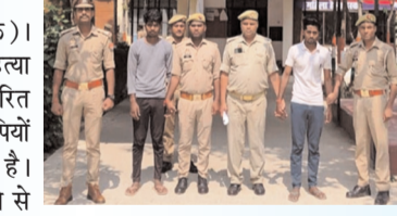
गिरफ्तार आरोपियों को पुलिस ने त्वरित कार्रवाई करते हुए दो आरोपियों को गिरफ्तार कर लिया है।