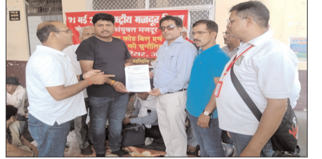
एक ज्ञापन श्रम आयुक्त, उत्तरप्रदेश सरकार को ईमेल के माध्यम से एवं सहायक श्रम आयुक्त, जौनपुर के माध्यम से प्रेषित किया। उसके बाद जौनपुर ईकाई के सदस्यों ने अपने इनकाई प्रांगण में अपने तथा अन्य संगठनों के साथ मजदूर दिवस मनाया। जिसमें यू.पी.एम.एस.आर.ए के राज्य ईकाई सह सचिव ने बताया कि कॉम्पैट एम सिंगारवेलु ने 1 मई 1923 को मद्रास (चेन्नई) में लाल झंडा फहरा कर भारत में मजदूर

जौनपुर (उत्तरशक्ति)। 01 मई मजदूर दिवस के अवसर पर यू.पी.एम.एस.आर.ए जौनपुर इकाई के सदस्यों ने अपनी मांगों को लेकर