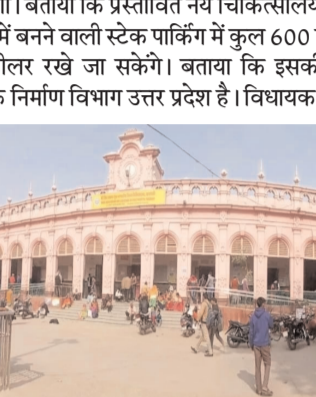
नया चिकित्सालय का निर्माण कार्य

14 का होगा। बताया कि प्रस्तावित नये चिकित्सालय के बेसमेंट बी1, बी2 में बनने वाली स्टेज पार्किंग में कुल 600 फीर व्हीलर और टू व्हीलर रखे जा सकेंगे। बताया कि इसकी कार्यवाही संस्था लोक निर्माण विभाग उत्तर प्रदेश है। विधायक ने कहा कि