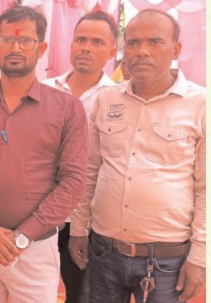
समारोह में शामिल हुए दिग्गज नेता

बड़ी संख्या में राजनीतिक, सामाजिक एवं क्षेत्रीय गणमान्य लोग कार्यक्रम में शामिल हुए। कार्यक्रम स्थल पर अतिथियों के स्वागत के लिए विशेष व्यवस्थाएं की गई थीं। ग्रामीणों एवं समर्थकों में अपने प्रिय नेताओं को निकरने से देखने की उन्माद से मुलाकात करके लेकर खोसा उस्ताह दिखाई दिया। पूरे समारोह में सामाजिक सौहार्द, भाईचारे एवं पारिवारिक अपनत्व का वातावरण बना रहा। उपस्थित नेताओं ने कहा कि ऐसे सामाजिक एवं पारिवारिक कार्यक्रम समाज में आपसी प्रेम, सहयोग और एकता को मजबूत करते हैं। वहीं क्षेत्रीय लोगों ने भी कार्यक्रम की भव्यता एवं व्योचनार्थों की सराहना करते हुए आयोजक परिवार को शुभकामनाएं दीं। समारोह देर रात तक हर्षोल्लास एवं उत्साहपूर्ण वातावरण में चलता रहा।