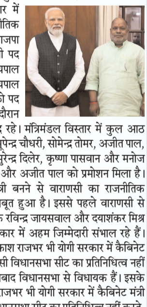
मंत्रिमंडल विस्तार में शामिल हुए मंत्री