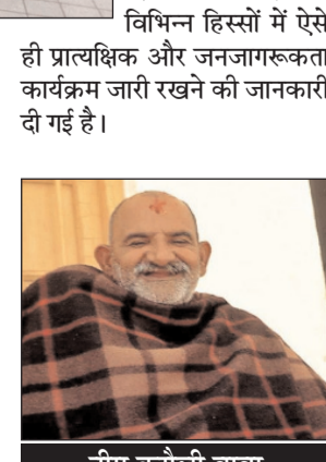
नीम करौली बाबा