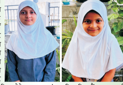
खेतासराय, जौनपुर (उत्तरशक्ति)। क्षेत्र के मॉडर्न कान्वेंट स्कूल की नई छात्राओं ने शैक्षिक सत्र 2025-26 के परीक्षा परिणाम में शानदार प्रदर्शन कर पूरे क्षेत्र का नाम रोशन किया है।