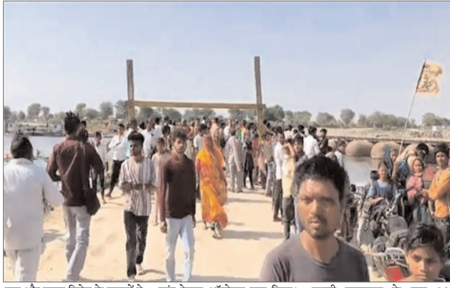
बल और फायर ब्रिगेड के जवानों ने तुरंत रेस्क्यू ऑपरेशन शुरू किया। काफी मशक्कत के बाद 22

मथुरा, 10 अप्रैल। उत्तर प्रदेश के मथुरा जिले में एक दर्दनाक हादसे ने श्रद्धालुओं को झकझोर कर रख दिया। यहां श्रद्धालुओं से भरी एक नाव पाटन पुल से टकराकर अचानक पलट गई, जिससे बड़ा हादसा हो गया। इस दुर्घटना में अब तक 10 लोगों की मौत की खबर सामने आई है। इस हादसे पर सीएम योगी ने गहरा दुख व्यक्त किया है। पुलिस के अनुसार, नाव में सवार श्रद्धालु पंजाब के लुधियाना शहर से आए थे और वृंदावन से देवराहा बाबा मठ की ओर जा रहे थे। इसी दौरान नाव मरम्मत कार्य चल रहे पाटन ब्रिज से टकरा गई और संतुलन बिगड़ने से पलट गई। घटना की सूचना मिलते ही पुलिस और प्रशासन की टीम मौके पर पहुंच गई। राज्य आपदा प्रतिक्रिया