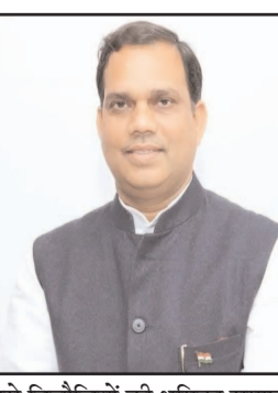
इससे विचौलियों की भूमिका समाप्त होगी और शिल्पकारों को उनकी मेहनत का सीधा लाभ मिल सकेगा।

सीमाएँ सिकुड़ रही हैं और उपभोक्ता की पहुँच वैश्विक स्तर पर बढ़ रही है, ऐसे में मध्य प्रदेश के कुटीर और ग्रामोद्योग विभाग की यह पहल प्रदेश के पारंपरिक कौशल को एक नई पहचान दिलाने के साथ-साथ युवाओं और महिलाओं के लिए रोजगार के अनंत द्वार खोलने वाली है। मुख्यमंत्री का यह दृष्टिकोण कि वर्तमान समय ई-कॉमर्स का है, इस सच्चाई को स्वीकार करता है कि यह हम अपनी विरासत को समय की मांग के साथ नहीं जोड़ेंगे, तो वह केवल संग्रहालयों तक सीमित रह जाएगा। इस पोर्टल के माध्यम से राज्य के हस्तशिल्प और हथकरघा उत्पादों को ओपनडीसी जैसे विशाल प्लेटफॉर्म से एकीकृत करने का निर्णय एक मास्टरस्ट्रोक है, क्योंकि